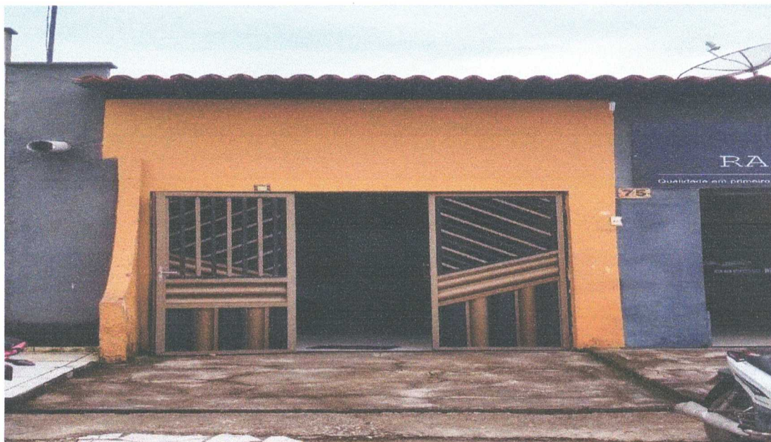
FACHADA FRONTAL EXTERNO