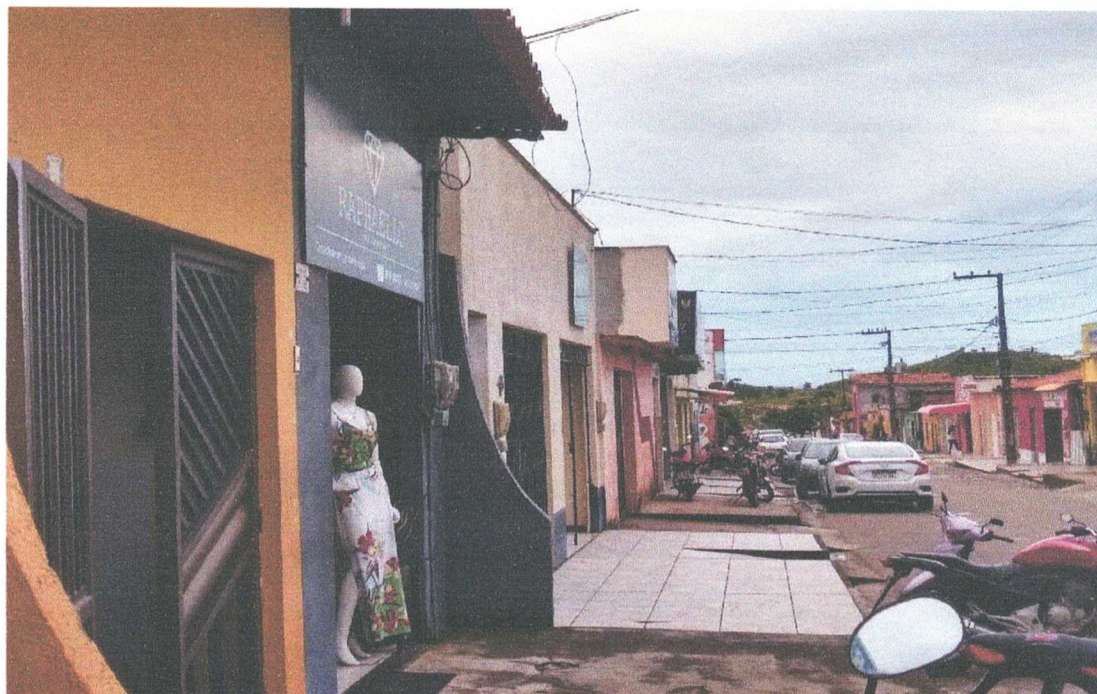
FACHADA FRONTAL EXTERNO