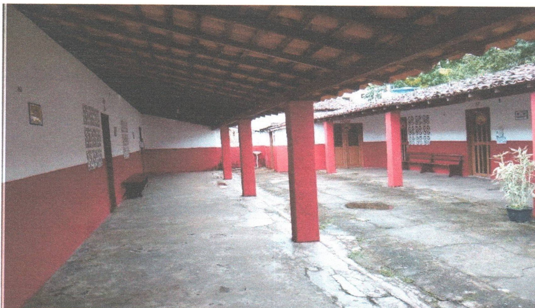
ÁREA INTERNA PÁTIO