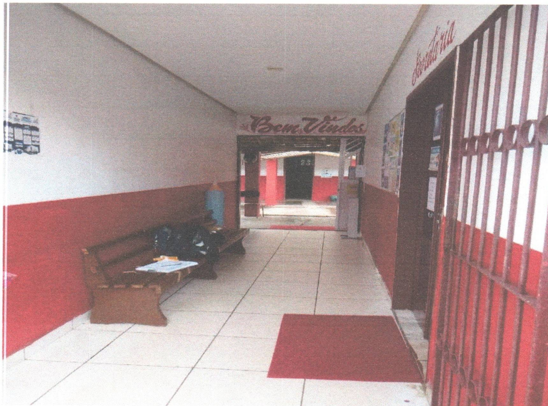
ÁREA DE CIRCULAÇÃO

Estado do Maranhão PREFEITURA MUNICIPAL DE SANTA LUZIA DO PARUÁ CNPJ nº. 12.511.093/0001-06