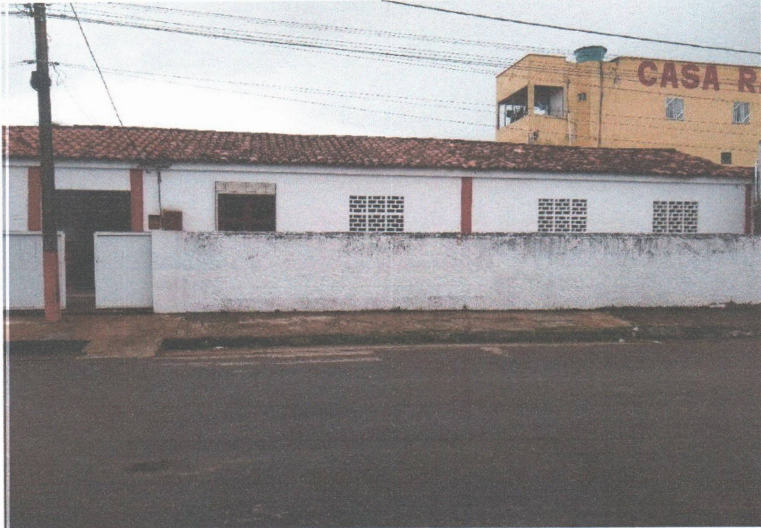
FACHADA FRONTAL EXTERNO