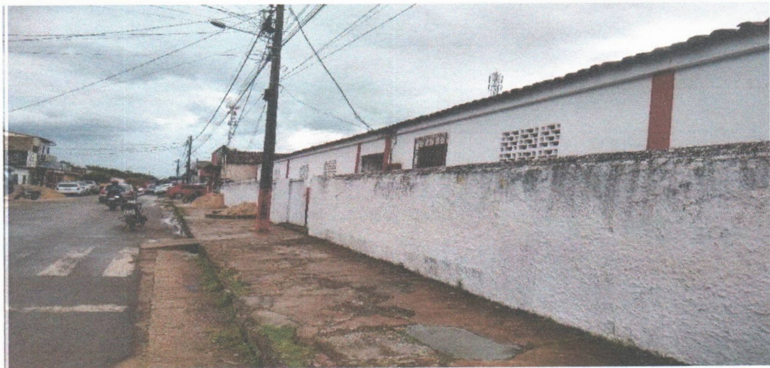
FACHADA FRONTAL EXTERNO