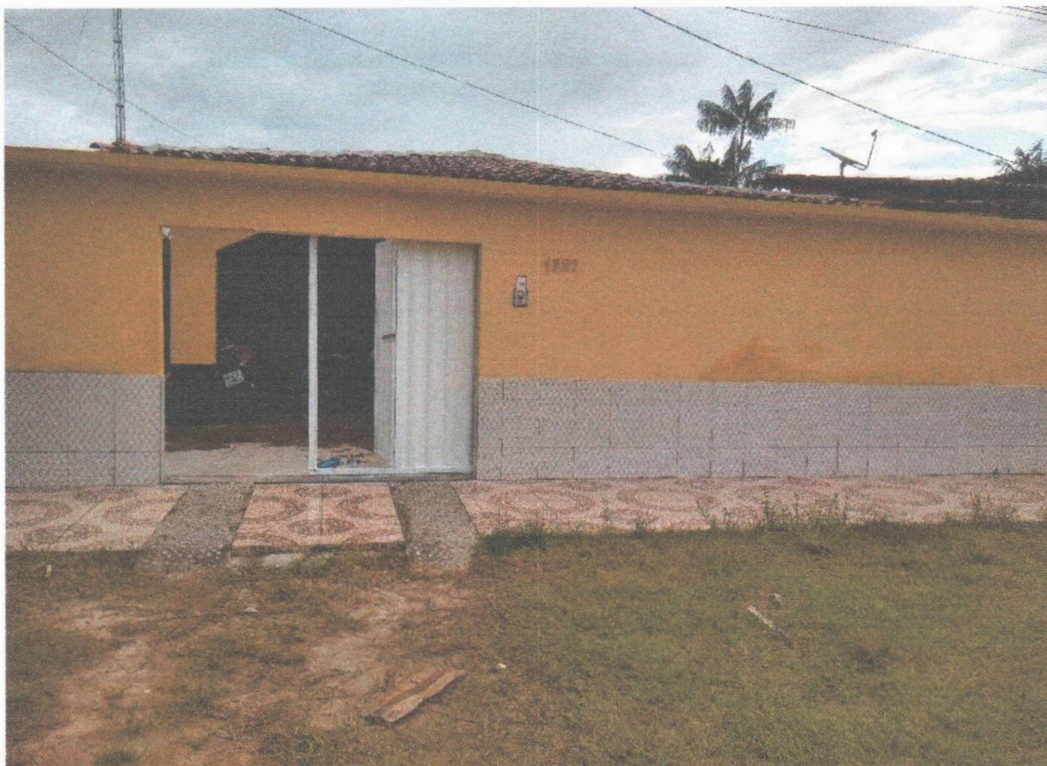
FACHADA FRONTAL EXTERNO