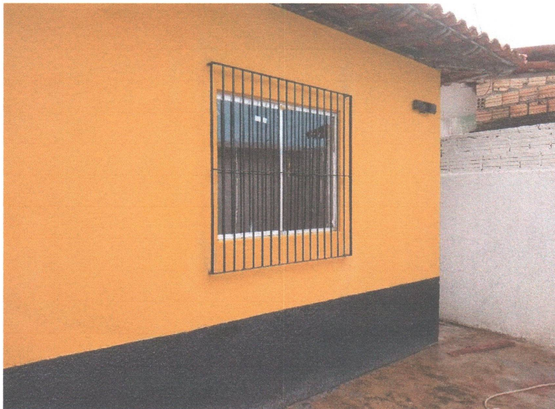
FACHADA FRONTAL INTERNO

Estado do Maranhão PREFEITURA MUNICIPAL DE SANTA LUZIA DO PARUÁ CNPJ nº. 12.511.093/0001-06