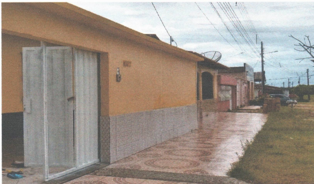
FACHADA FRONTAL EXTERNO