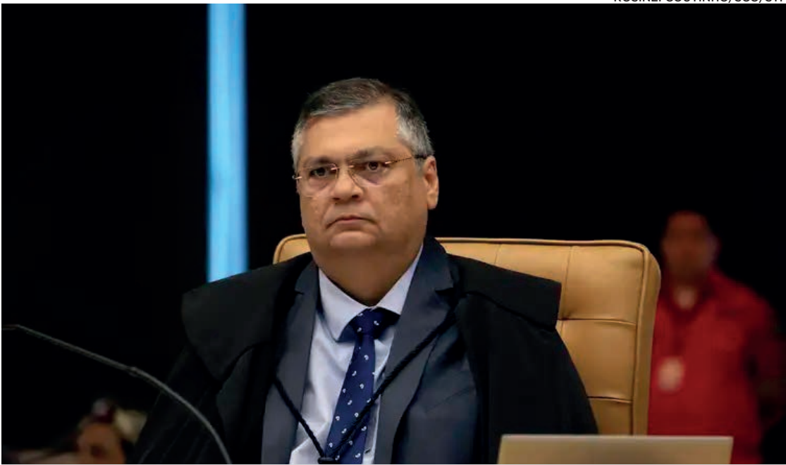
Ministro Flávio Dino, na sessão plenária do STF

Até o fim do ano, o governo federal terá à disposição um orçamento de emergência climática para enfrentar os incêndios florestais que atingem cerca de 60% do país. O ministro do Supremo Tribunal Federal (STF) Flávio Dino autorizou a União a emitir créditos extraordinários fora dos limites fiscais para o combate às chamas. Com a autorização de Dino, o governo poderá enviar ao Congresso Nacional medida provisória (MP) apenas com o valor do crédito a ser destinado. Embora, por definição, os créditos extraordinários estejam fora da meta de déficit primário e do limite de gastos do atual arcabouço fiscal, a decisão de Dino evita que os gastos voltem a ficar dentro das limitações, caso o Congresso não aprove a MP ou o texto perca a validade. Na prática, a decisão cria um modelo de gastos semelhante ao adotado na pandemia de covid-19. Em 2020, o Congresso autorizou um orçamento especial para as ações contra o coronavírus, apelidado de Orçamento de Guerra. Dino também flexibilizou a regra para a manutenção e a contratação de brigadistas temporários. Até o fim do ano, o Instituto Brasileiro do Meio Ambiente e dos Recursos Naturais Renováveis (Ibama)