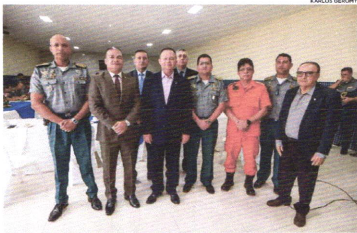
Evento reuniu autoridades do Estado para alinhar estratégias de segurança pública