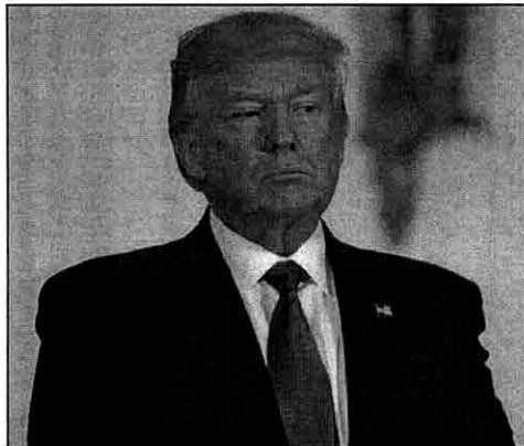
O presidente Donald Trump, que teria pedido para encerrar investigação

negou que Trump tenha feito qualquer pedido a Comey e disse que a reportagem não é um "retrato verdadeiro ou exato da conversa" dos dois.