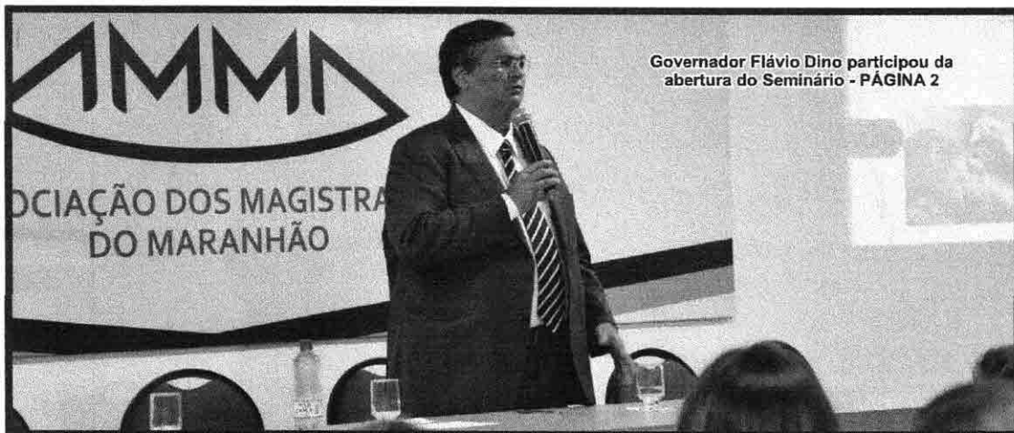
Governador Flávio Dino participou da abertura do Seminário - PÁGINA 2