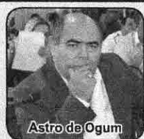
Astro de Ogum

STF abre cinco dias de prazo para que governo explique aumento dos combustíveis PÁGINA 3