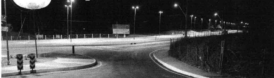
Orla da praia do Araçagi, em São José de Ribamar, pavimentada por meio do Programa Mais Asfalto - PÁGINA 2

Colisão entre caminhonete e carreta deixa uma pessoa morta