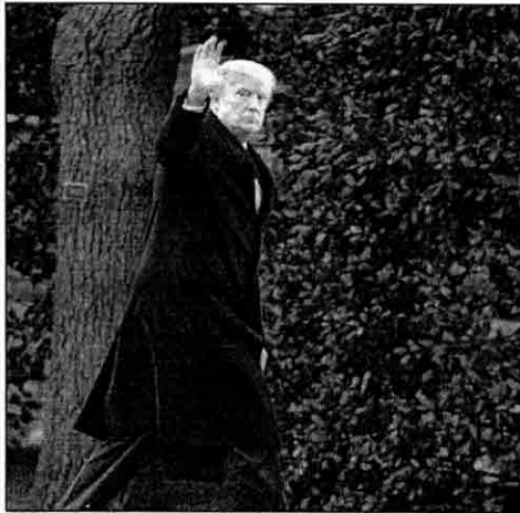
Presidente Donald Trump acena enquanto chega à Casa Branca

O presidente dos Estados Unidos, Donald Trump, assinou nesta segunda-feira uma nova ordem executiva para migração, após a Justiça suspender a primeira versão do decreto que provocou uma onda de indignação pelo mundo. O texto revisado — que deverá entrar em vigor no próximo dia 16 — mantém o bloqueio temporário a imigrantes e a refugiados de seis países de maioria muçulmana, retirando o Iraque da lista de países barrados. A versão levemente atenuada do decreto foi rapidamente criticada pelos democratas, que chamaram "a obsessão de Trump com a discriminação religiosa".