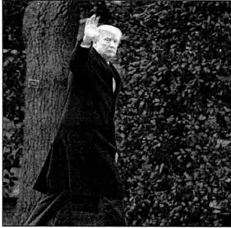
Presidente Donald Trump acena enquanto chega à Casa Branca

O presidente dos Estados Unidos, Donald Trump, assinou nesta segunda-feira uma nova ordem executiva para migração, após a Justiça suspender a primeira versão do decreto que provocou uma onda de indignação pelo mundo. O texto revisado — que deverá entrar em vigor no próximo dia 16 — mantém o bloqueio temporário a imigrantes e a refugiados de seis países de maioria muçulmana, retirando o Iraque da lista de países barrados. A versão levemente atenuada do decreto foi rapidamente criticada pelos democratas, que iniciaram "a obsessão Trump com a discriminação religiosa".