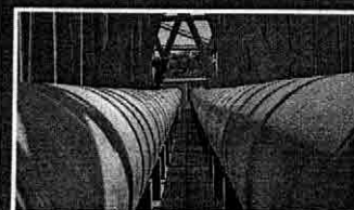
Sistema Italuís PÁGINA 2

Nova adutora começa a funcionar para reforçar abastecimento