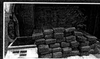
Foram presos três suspeitos PÁGINA 8

Quase 150 kg de maconha prensada são apreendidos em Paço do Lumiar