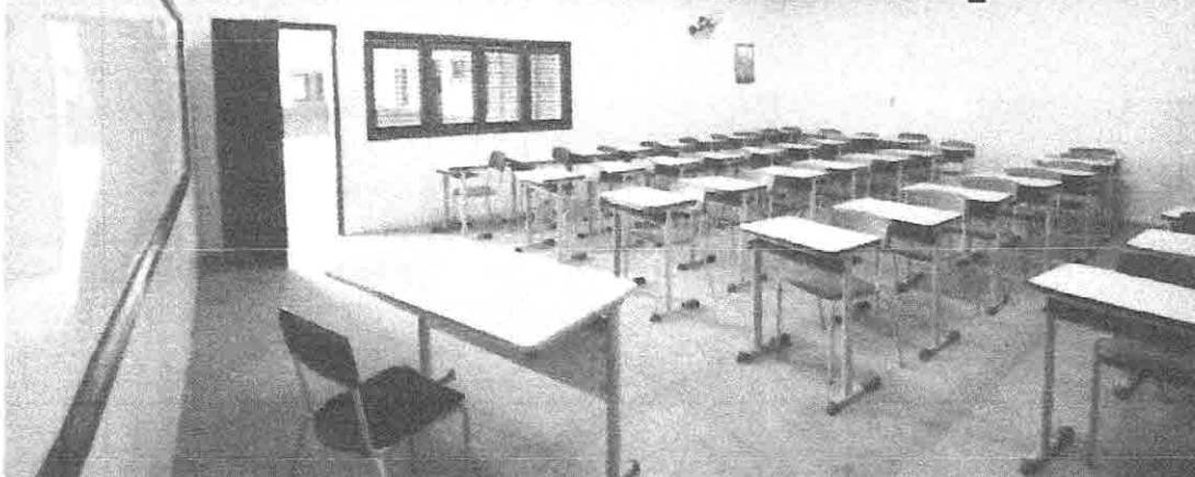
Governo entrega equipamentos de educação e anuncia investimentos em Pirapemas - PÁGINA 2

OPERAÇÃO SEMANA SANTA Aumenta número de acidentes nas rodovias que cortam o Maranhão