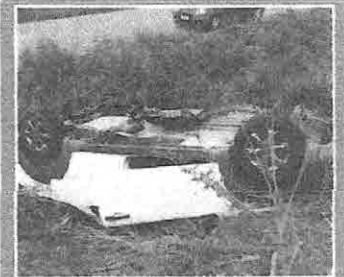
Acidente em Campo de Perizes PÁGINA 8

OPERAÇÃO SEMANA SANTA Aumenta número de acidentes nas rodovias que cortam o Maranhão