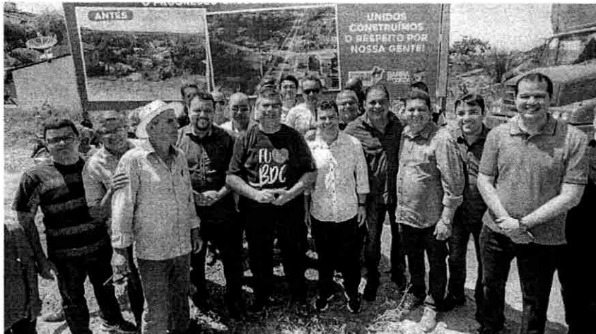
A obra era um sonho antigo da população e vai beneficiar mais de 5 mil pessoas

O governador Flávio Dino aproveitou a solenidade de entrega da obra no Purus para conceder títulos de terra a dois moradores, em reconhecimento a propriedade plena da terra aos agricultores que a ocupam. Página 6