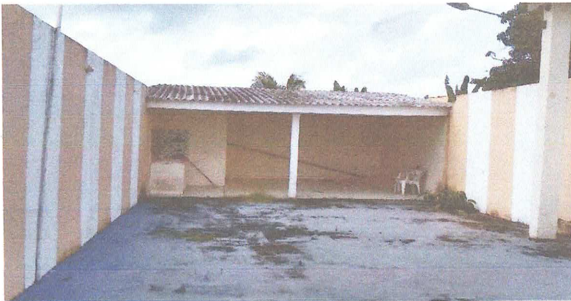
ÁREA DE SERVIÇO