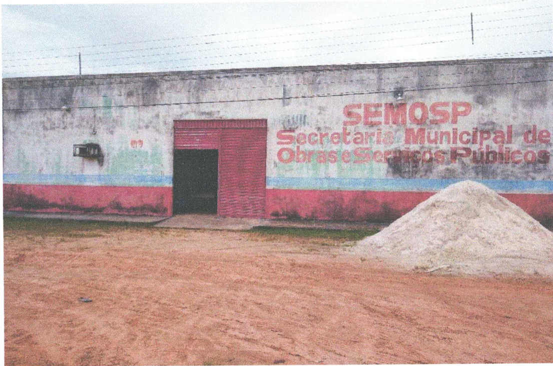
FACHADA FRONTAL EXTERNO