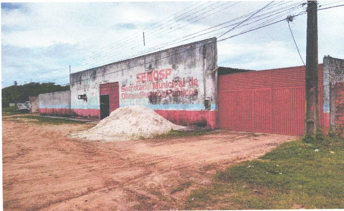
FACHADA FRONTAL EXTERNO

[Handwritten signature] [Handwritten signature]